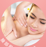
臉部與身體的療法